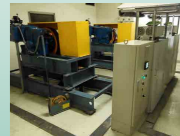
電梯電能回收 - 加裝節能櫃回收電能