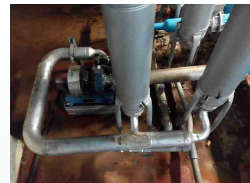
水力發電 - 自來水入水管安裝發電設備