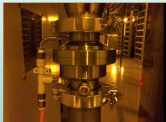
Dry pump 節能 - 安裝真空節能器