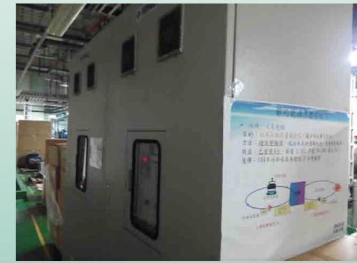
冰機一次泵變頻 - 增設變頻器使流量最佳化