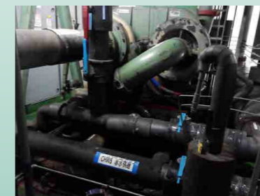
空壓機廢熱回收 - 增設暖水管路回收廢熱