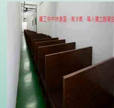
員工午休舒適環境