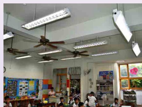
裝置省水感應馬桶設施