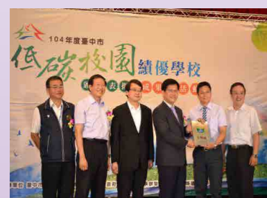
榮獲臺中市低碳校園認證金牌獎