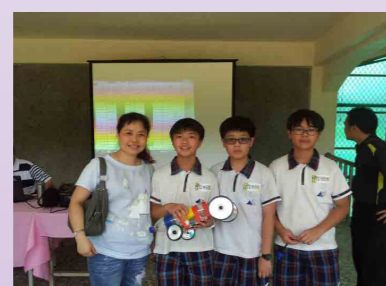
參加臺中市水力能創意玩具競賽榮獲第一名