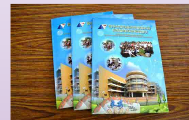
學校能源教育教學指引