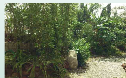
5 德仲顧問有限公司 6 綠化隔熱降溫室內 3 度