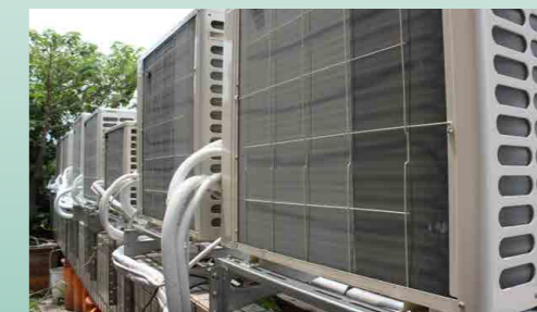
空調汰換 - 新空調室外機