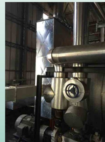
鍋爐尾氣回收預熱