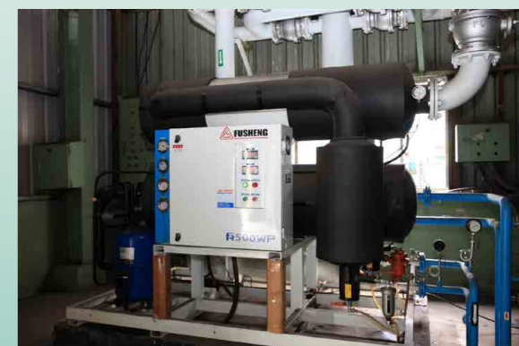
檢測數據進行空壓系統整合 - 精算實際需求風量後整合乾燥機減少台數