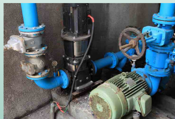
依實際需求調整泵浦馬力 - 檢視計算實際需求調整餘度，降低泵浦馬力數