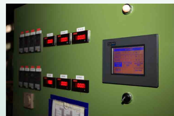
自動化管理預熱時間 - 熔膠機原為全天預熱，新增預熱時間預設功能