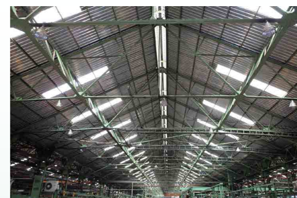
自然光源與廠房照明定時切換管控 - 開設屋頂透光罩白天不用開啟廠房照明