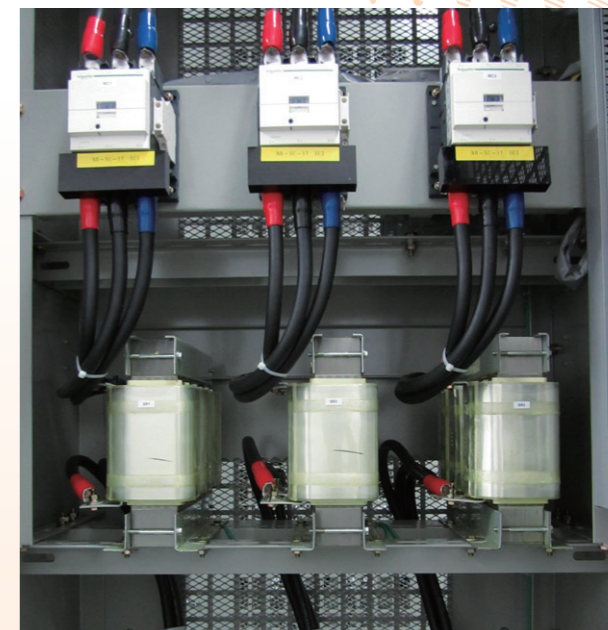
自行開發電容器放電裝置