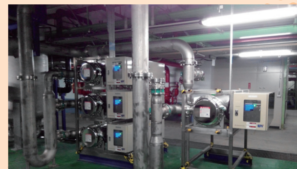
使用高效能 TOC UV Lamp