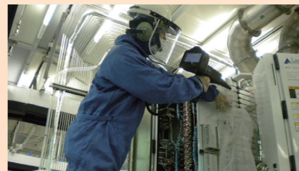
使用超音波儀器檢查生產機台洩漏