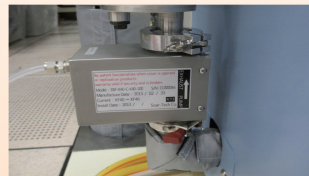
安裝 PSU 裝置，減少 Dry Pump 壓降