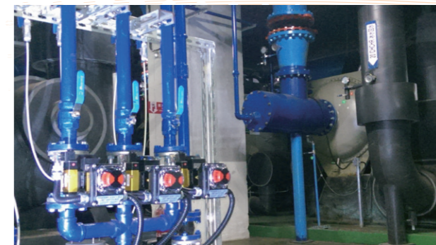
冰機冷凝器自動清洗機