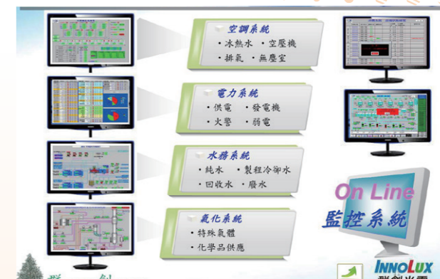
建置能源監控系統