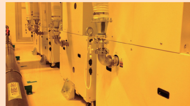
自主研發設置 Dry pump 真空節能器