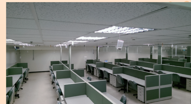
使用 LED 節能燈具及拉扣