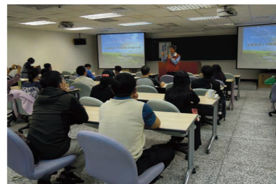
宜蘭縣能源科技教育教案分享