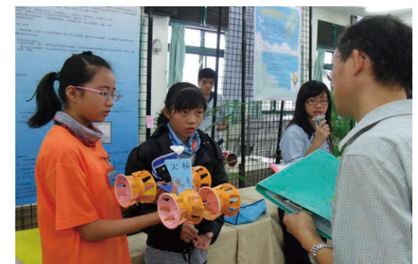
國中小能源科技創意車實作競賽