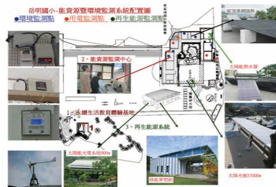
能資源暨環境監測系統配置圖