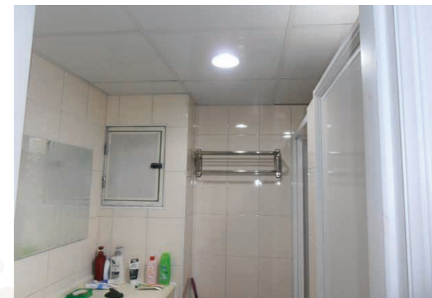
學生宿舍浴室 LED 燈