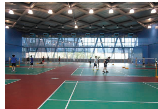
優活館空氣疊集效應節能設施