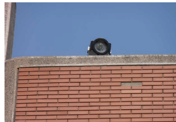
戶外教學變焦投光燈