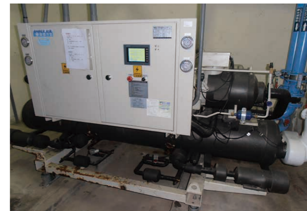
藝文中心高效率冰水主機