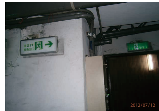
緊急出口更換 LED 燈