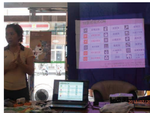
綠能樂活圖 - 節能工作坊實作 (2)