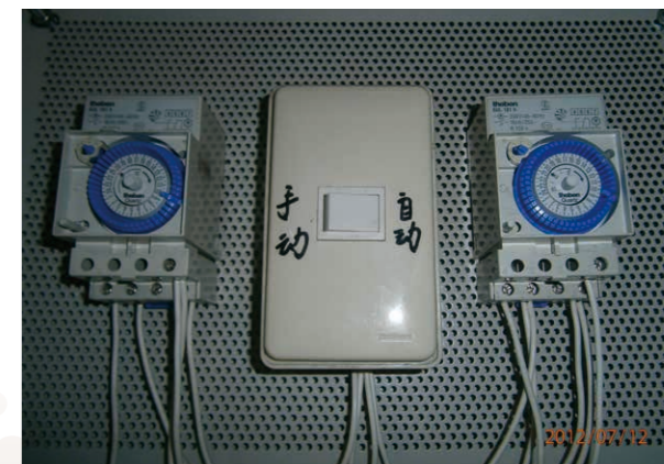
手動及自動定時器之使用