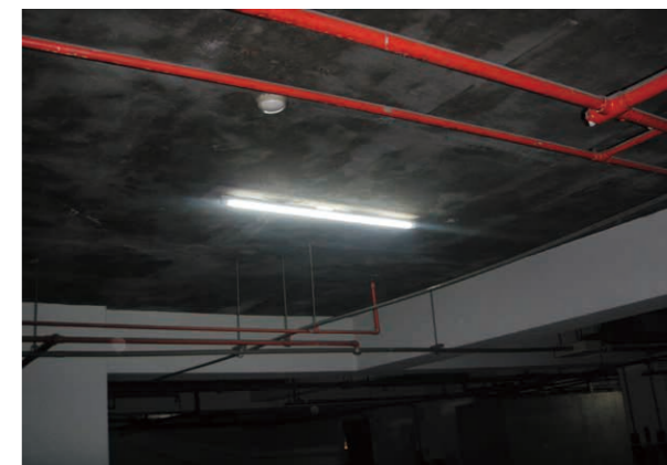
地下室停車場更換 T5 燈具