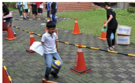
舉辦寓教於樂健康減碳10大宣言的闖關體驗活動