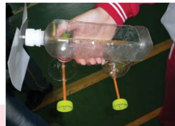
全市奧林匹亞科學競賽炫風飛車製作