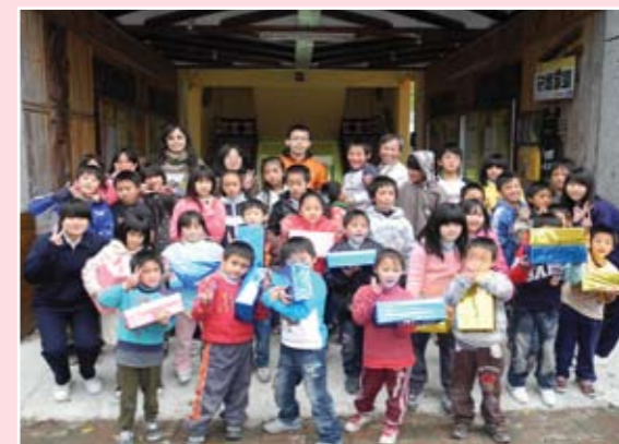
聖誕減廢節能學用品再利用送愛心到偏遠山區學校