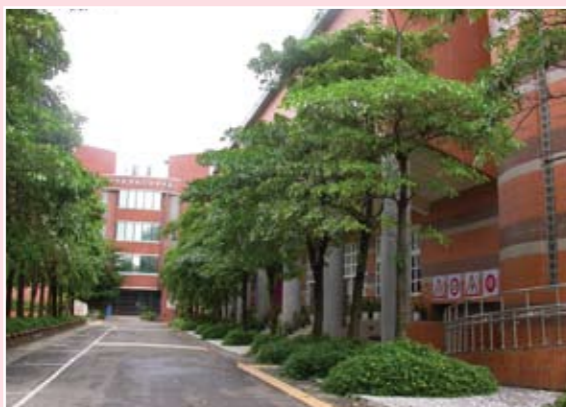
後校門黑板樹減碳步道