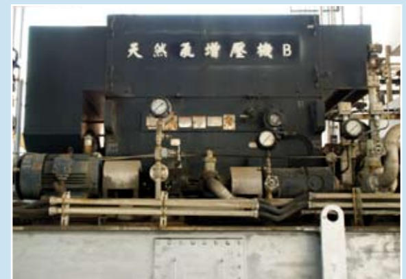
四號機天然氣增壓機停用之節能改善