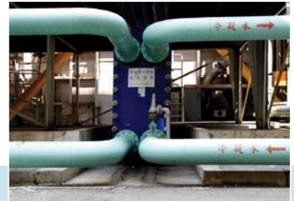
一~二號機熱量轉移理論實踐之應用改善