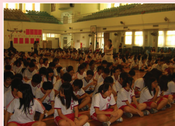
透過集會宣導能源知識