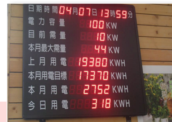
校園中設置用電量顯示面板，有利於教學