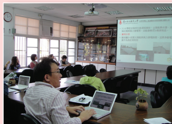
教師能源教案編寫研習