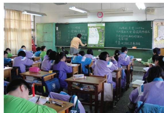
節能設施綠地圖課程教學