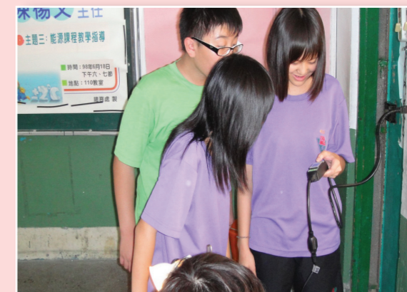
能源魔法學校課程教學