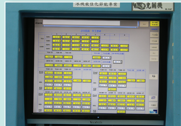
冰水最佳化_監控畫面