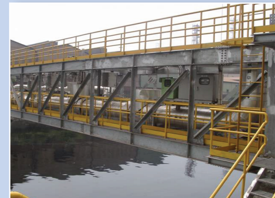
區域能源整合外售中石化公司蒸汽管線及管橋