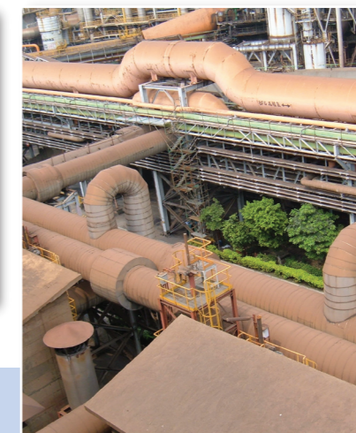
動力工場鼓風機冷鼓風管網