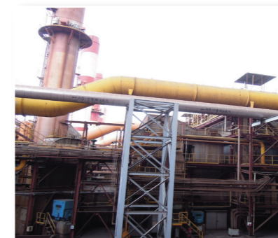
使用輔助燃料焦爐氣鍋爐