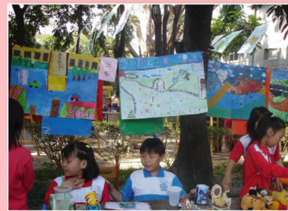
舉辦跳蚤市場與節能海報展