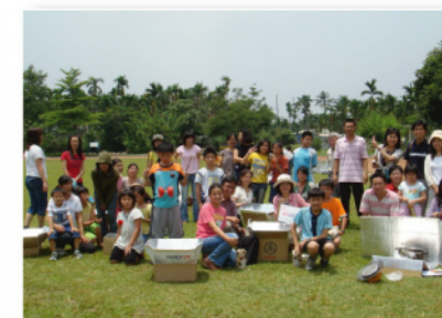
舉辦太陽能鍋爐競賽