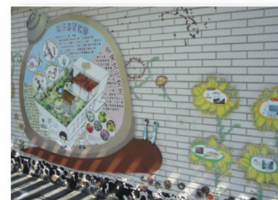
能園導覽教學園地