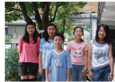
建安「省」政府組織-學生代表