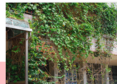
校內設置百香果綠籬以達降溫功效