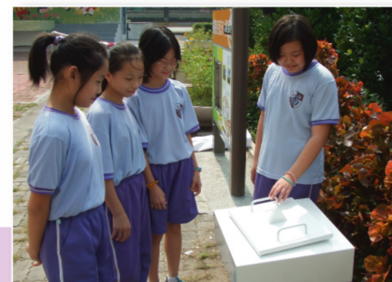
操作太陽能體驗教具