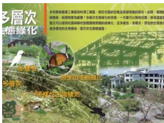
多層次生態綠化導覽板