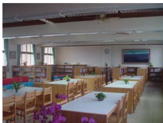
改善室內環境營造節能空間