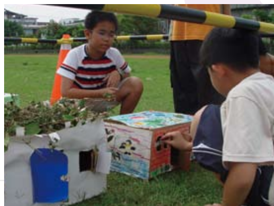
能源教育教學實景