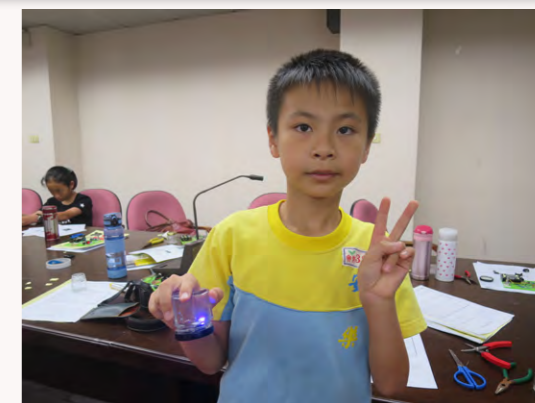
學生展示翻轉夜燈作品