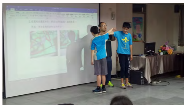
推動能源科技教師示範接電路