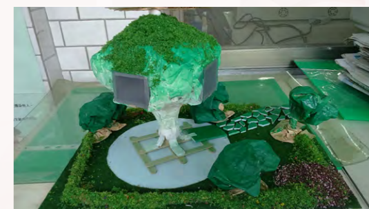
學生參加全市綠能屋競賽冠軍作品