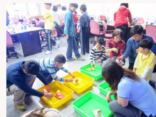
學生實作蒸氣動力船