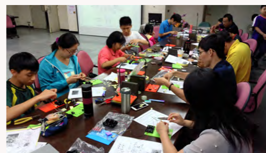
參與學員認真實作