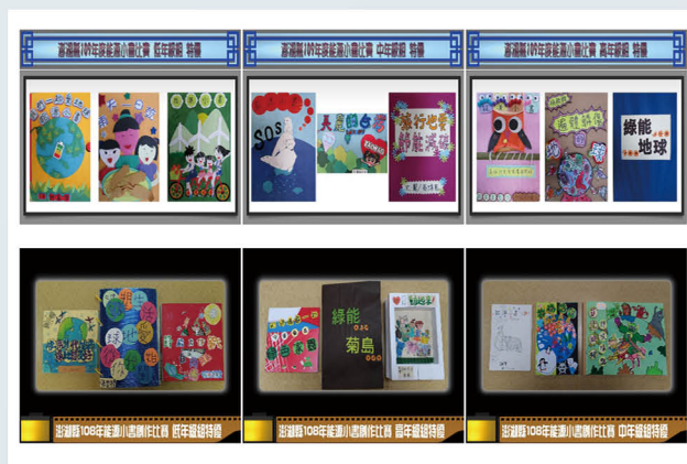
全縣能源小書創作比賽