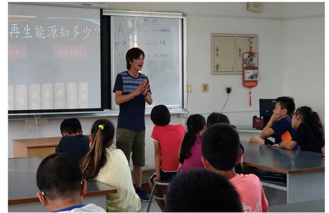
能源教育「再生能源知多少」