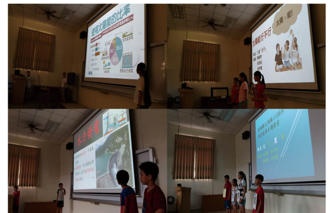
能源教育主題探索活動