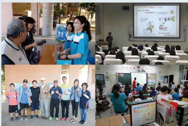
社區能源教育推廣活動