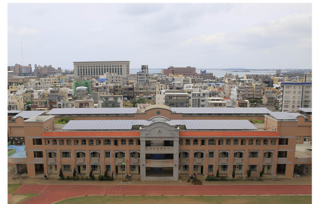
校舍頂樓太陽能發電基板