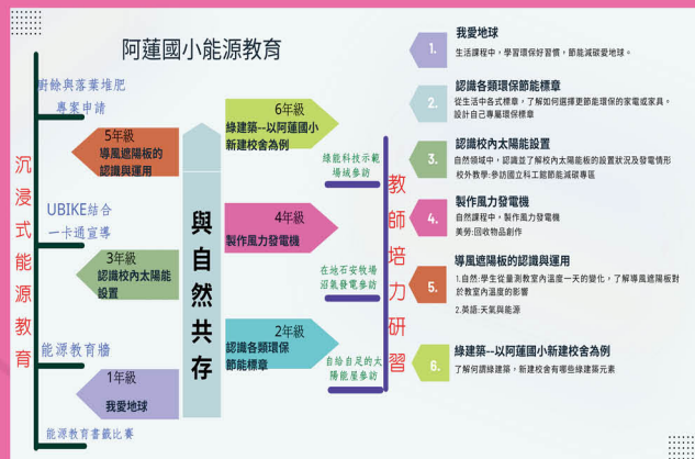
設計各年級沉浸式能源教育