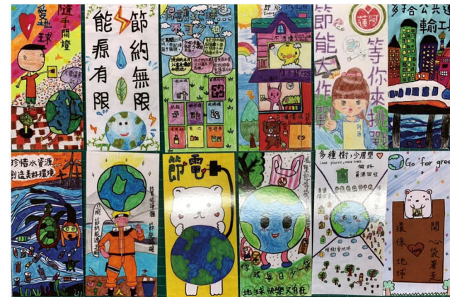
學生創意能源書籤