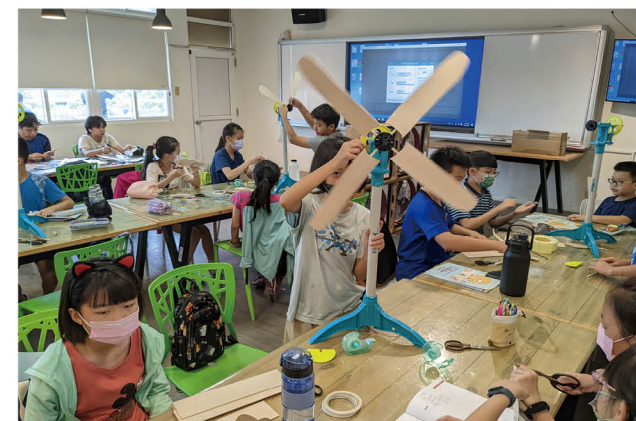
能源教育創客 - 風力發電課程體驗