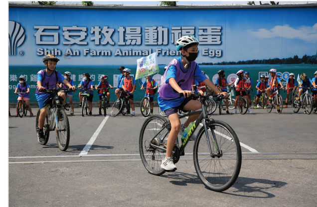
能源示範場域辦理能源單車活動