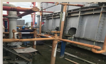
舊的中央儲冰系統