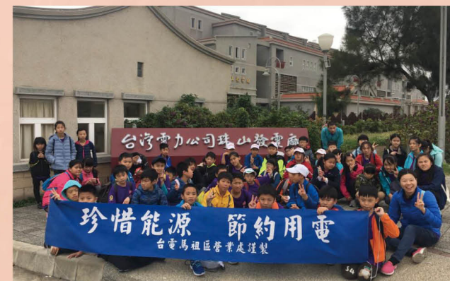
參觀台灣電力公司珠山發電廠