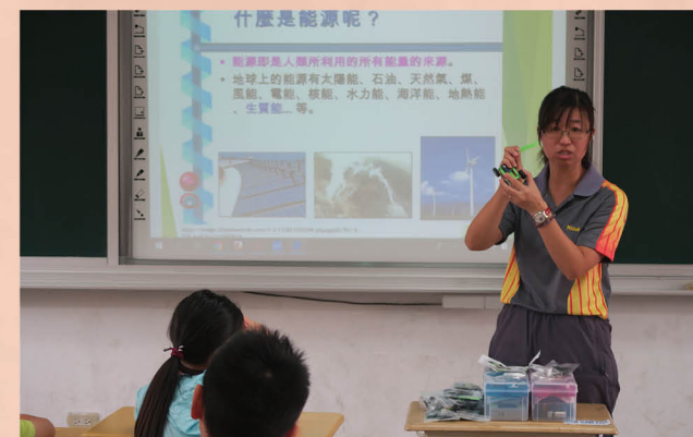
教師推廣能源教育