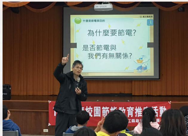
節能教育宣導活動