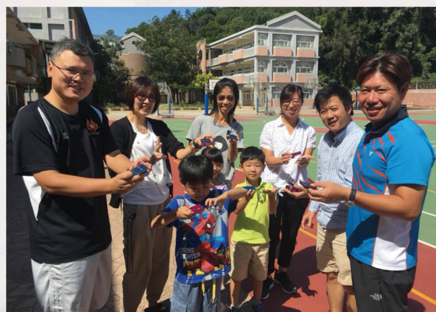
能源教育研習課程 - 太陽能車

連江縣由 30 餘個島嶼組成，島嶼眾多分散，為集中資源，每年暑假與輔英科技大學、臺中教育大學及葡萄園基金會合作辦理能源暑期營隊，邀請南竿鄰近學校共同參與，提高資源運用效率。