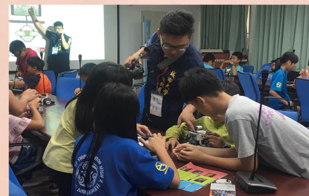
與大學合作深耕計畫辦理能源機器人研習