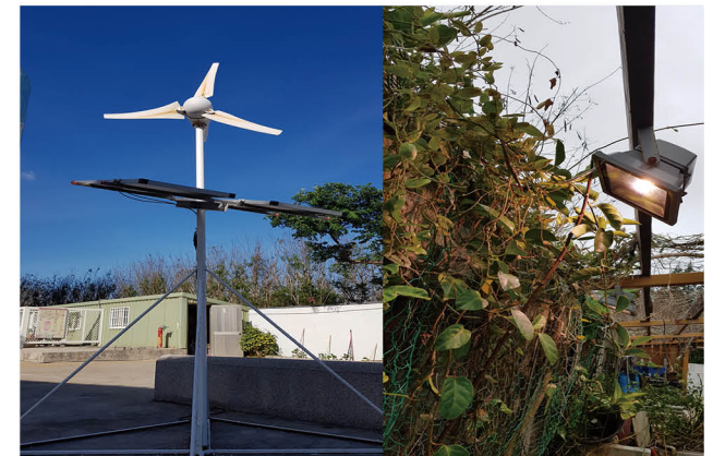
設置風光互補教學設備