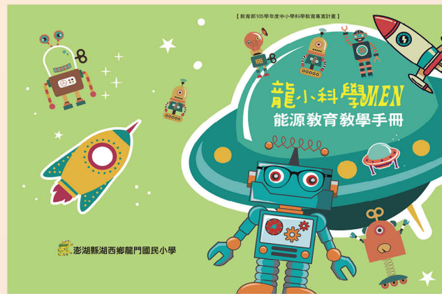
自編能源教育教學手冊