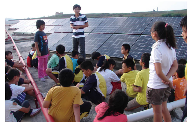
屋頂太陽能板課程