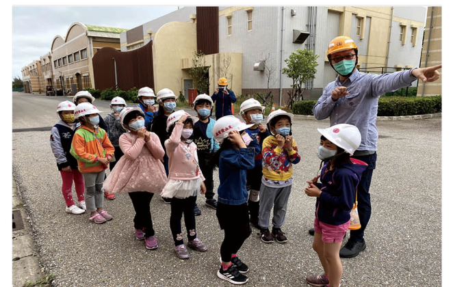
結合學區電廠合作辦理節能教學