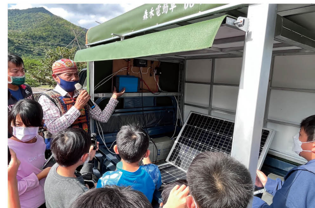
參訪綠能部落 - 達魯瑪克太陽能車