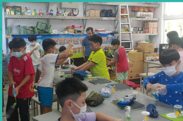
自然科學領域融入能源教育

充分利用校園環境，透過「緣起與想像」能源教育角，師生共同於此展示能源教育教材教具、節約能源熱氣球彩繪作品及標語創作等，發揮境教與走讀教學效果。