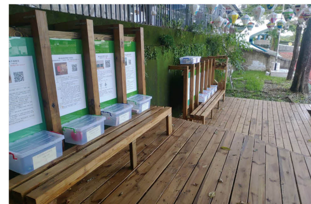
師生共學之能源教育平台