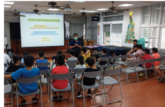
朝會時間宣導節約能源