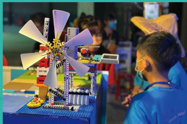
以能源為主題參加機器人比賽