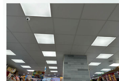
全家燈控 100 效能