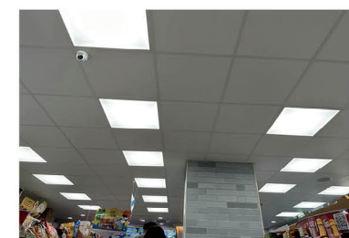
全家燈控 80 效能