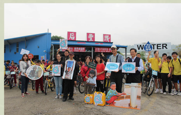
與鄰近學校合辦節能鐵馬活動