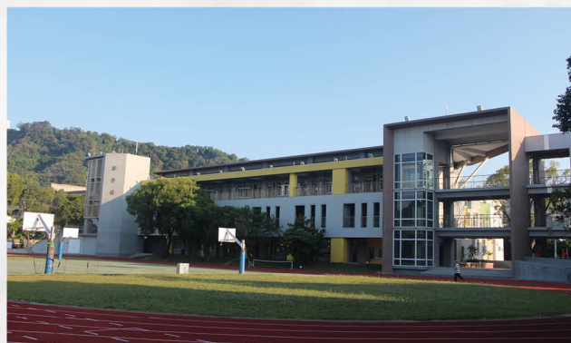
學校新建教學大樓榮獲綠建築標章