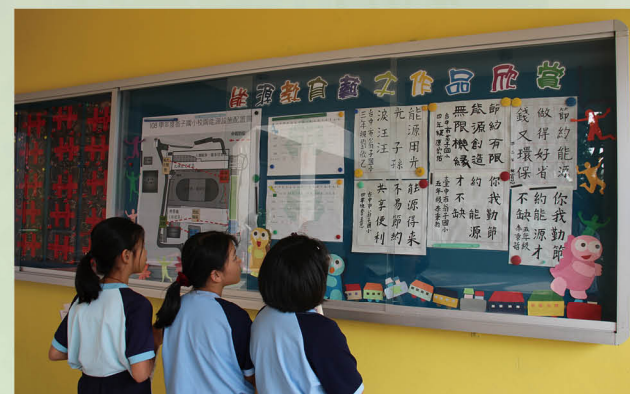
將跨領域能源教育作品展示於能源櫥窗