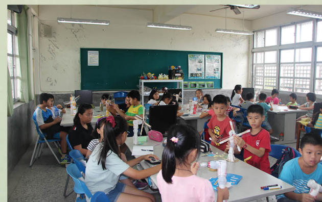
學生利用環保材料製作風力發電機