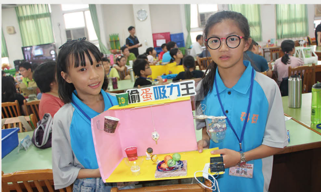
臺中市太陽能玩具競賽佳作