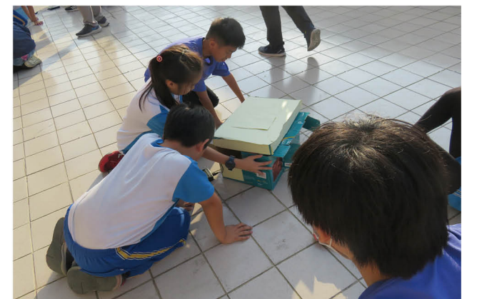
綠建築綠色魔法屋手作 DIY