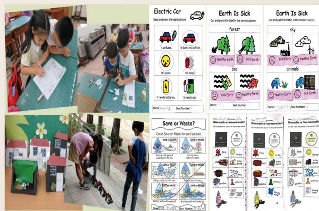
能源教育英語課程