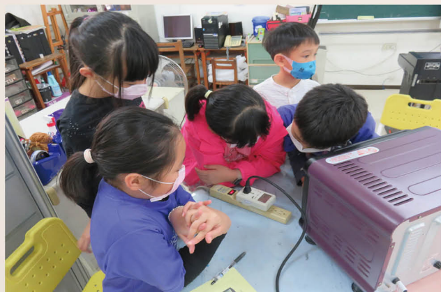
電力監測教學活動