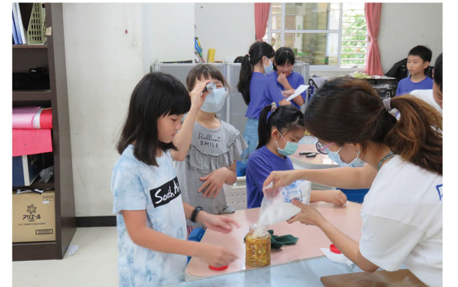
生質能生生不息 - 酒精實作