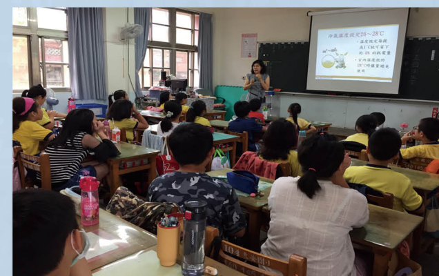
學生參與能源教育學習