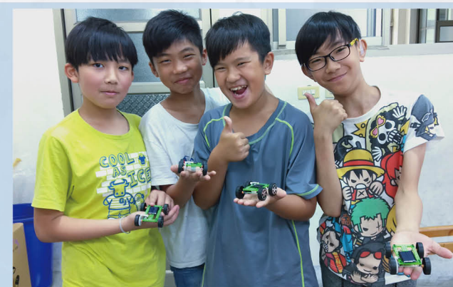
學生習取太陽能發電相關知識