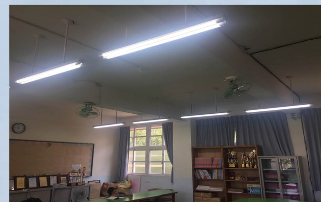
教室全面汰換為 LED 燈管