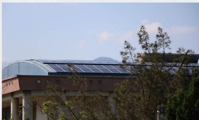
建置太陽能發電系統