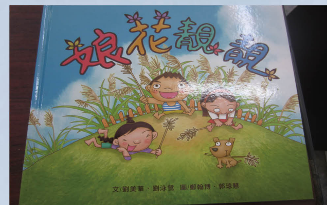
結合能源教育發展本土教育繪本