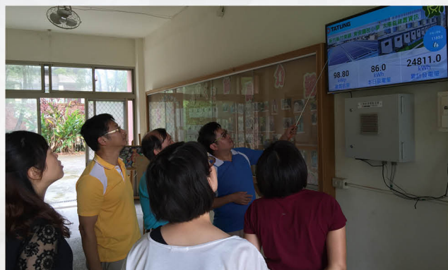
教師學習太陽能發電相關知識