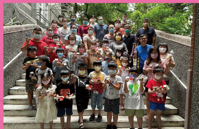
親子能源教育教具實作宣導