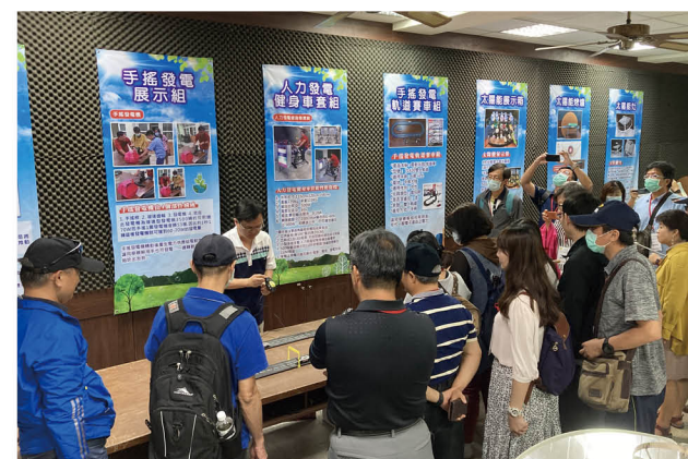
桃園市環境教育輔導團蒞校參訪綠能教室