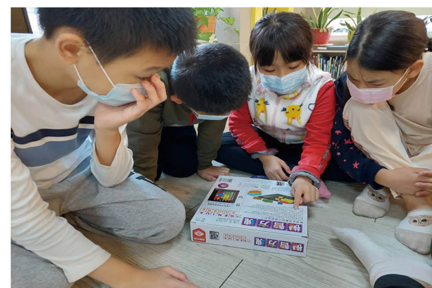
與研揚文教基金會合作開發能源教育桌遊