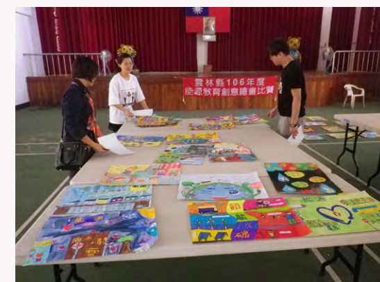
舉辦全縣能源創意繪畫比賽評選