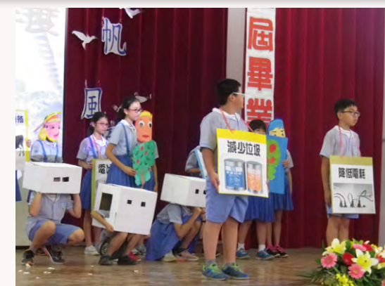
透過活動安排能源行動劇演出