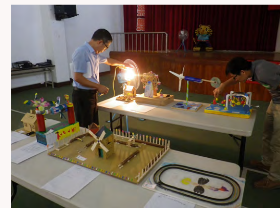
舉辦全縣能源玩具製作比賽評選