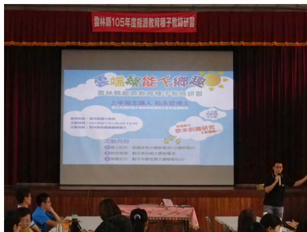
辦理全縣能源教育種子教師研習