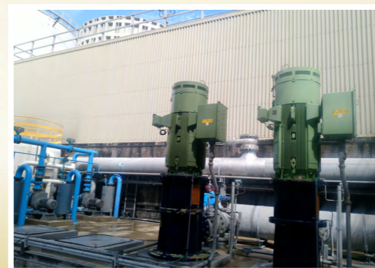
冷卻水塔水力分析