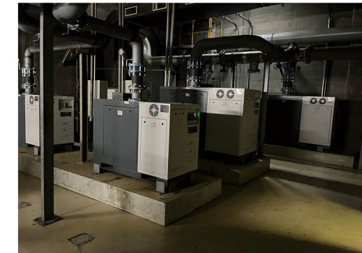
廢水系統節能 - 魯式鼓風機改為節能離心式鼓風機