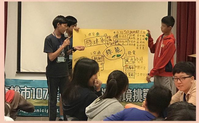
辦理暑假能源營隊