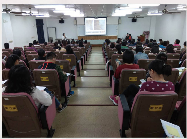
校長於校務工作會報說明節能永續計畫

能源教育課程完整包含日常課程及課外活動，運用大量能源教育教具及新興科技與課程結合，讓學生參與用電數據紀錄，了解節能的意義及實際作為，引發學習動機。