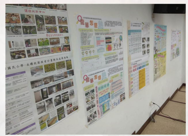
辦理校內及全國永續循環校園研討會