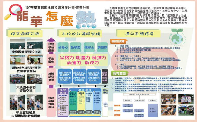
針對學校建築、能源設施及課程，設計相關推廣文宣資料