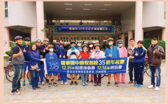
辦理 35 週年校慶節能減碳單車繞境活動