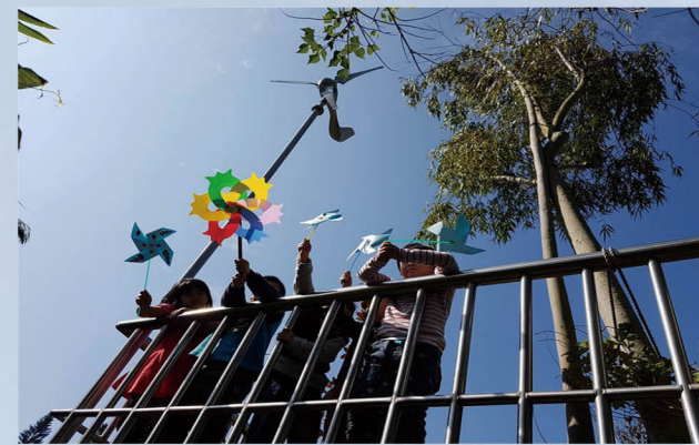
風車與風力發電教學