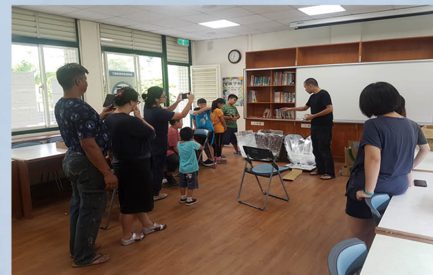
太陽能鍋製作親子活動