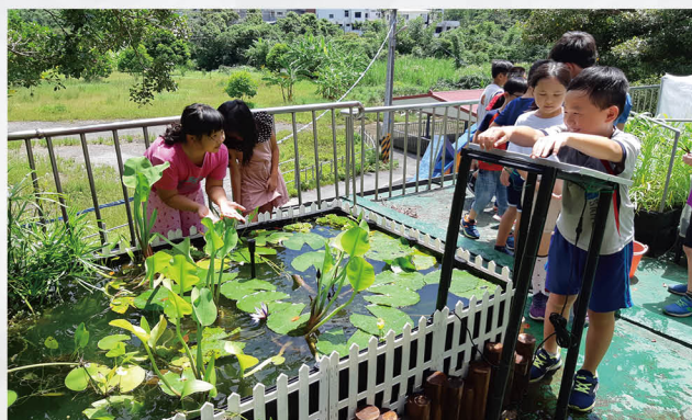
利用太陽能電力使水生池運作