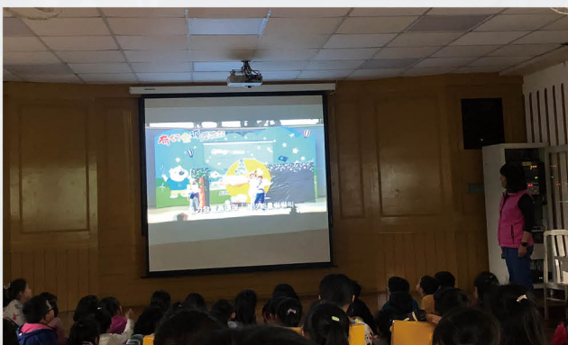
能源教育劇場欣賞活動