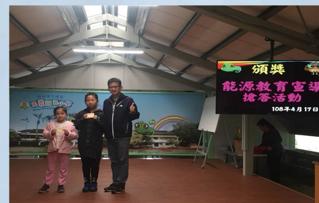
校長於能源教育宣導活動頒發節能獎