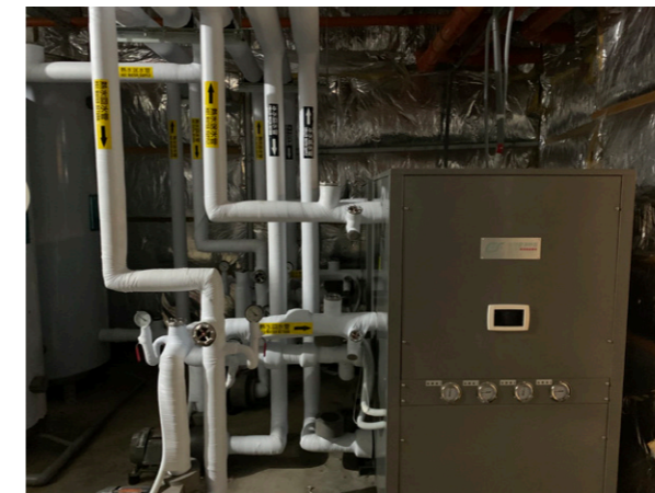
熱水 + 冰水 (作為空調)