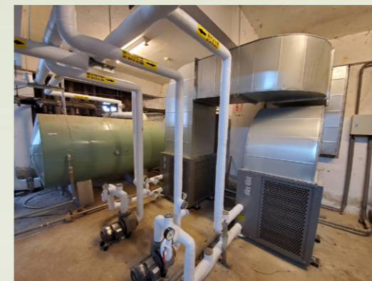
高效能氣冷式熱泵主機

水冷式為主、氣冷式為輔 在夏季時調整使水冷式熱泵全開，其可降低冰水主機之負載，進而降低冰水主機之耗電。冰水主機可卸載，則冷卻水塔和冷卻水泵均不需運轉。大幅降低耗電，也不會排出廢熱，降低地球暖化。