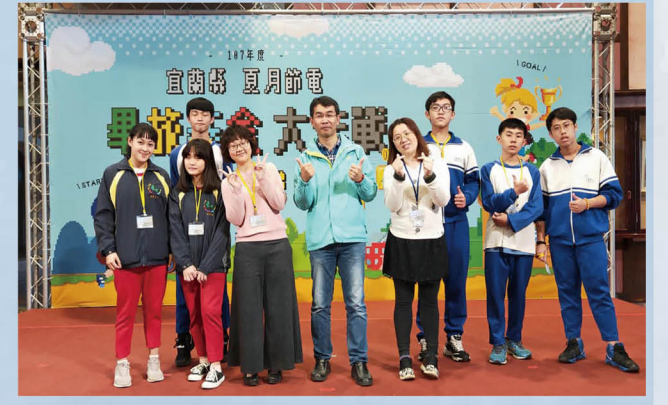
全縣節電大作戰比賽成績斐然