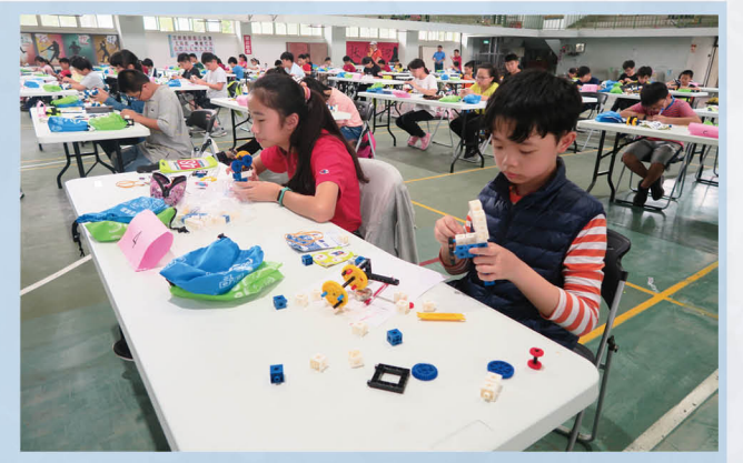
舉辦全縣「我的能源機器人」積木創作比賽