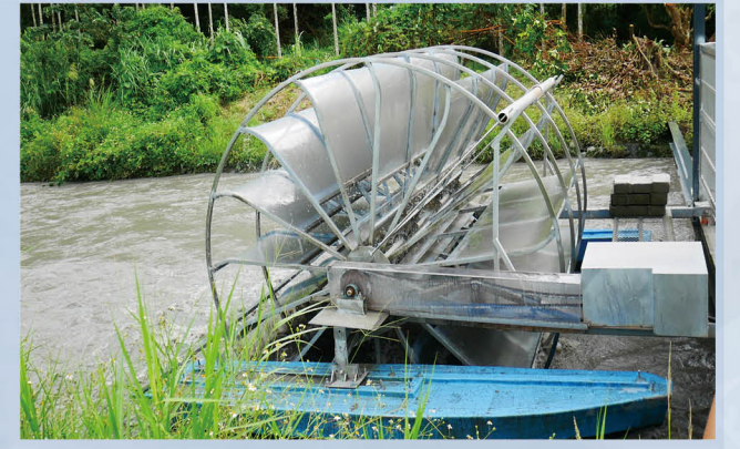
蘭陽發電廠 - 微型水力發電組