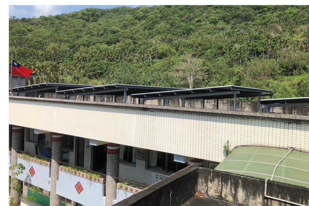
太陽能板並使用 EMS 系統監控管理