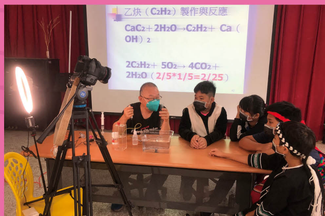
能源教室趣味能源教具