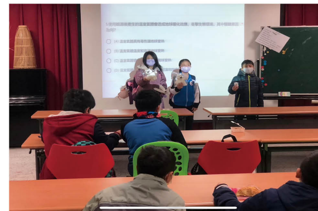
舉辦全校能源知識擂台賽