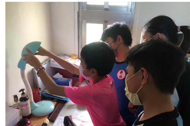
社區部落更換節能燈泡