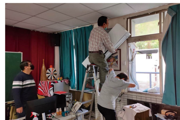
定期清洗冷氣與濾網