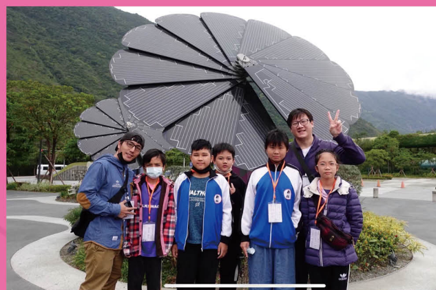
參觀台泥 DAKA 太陽能板