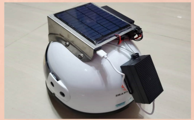
能源教育創意發明 風力太陽能發電空氣清淨安全帽