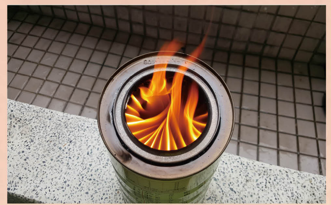
能源教育科學研究 - 二次燃燒