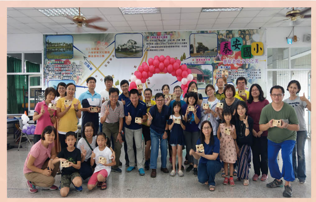
至外縣市辦理種子教師研習分享能源教育經驗