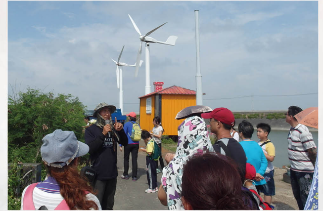
辦理親子能源教育參訪