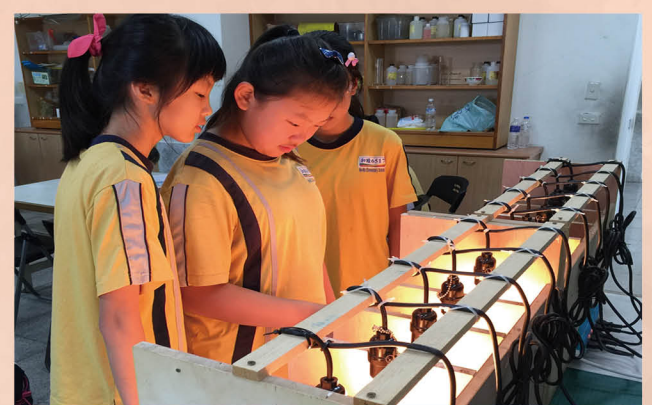
能源教育科學研究 - 綠建築與節能