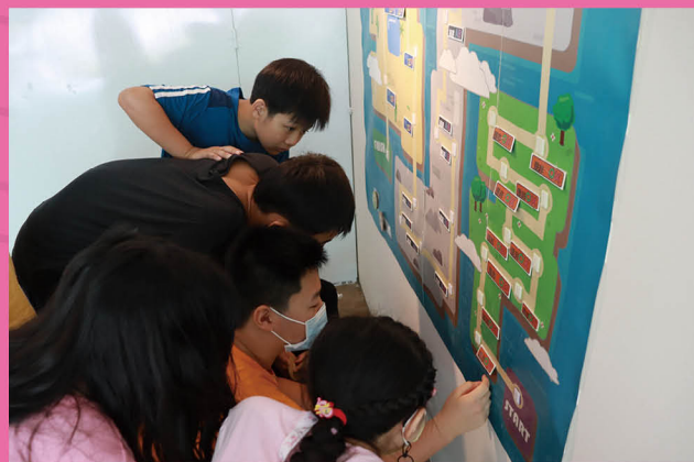
能源教育專區闖關遊戲