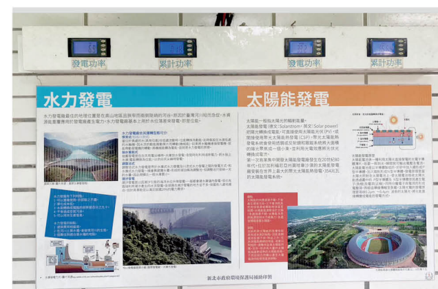
發電功率顯示教學