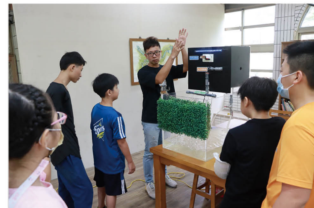
水力發電灑水系統模型講解