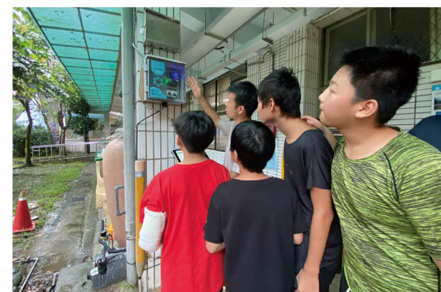
水力發電智能灑水系統