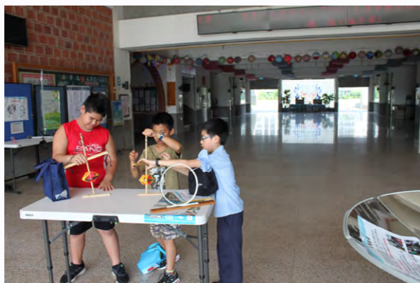
學童動手操作能源教具