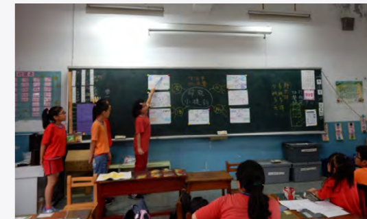
班級操作節能小捷豹討論課程