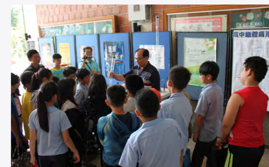
校外能源教育參訪學習發電機原理