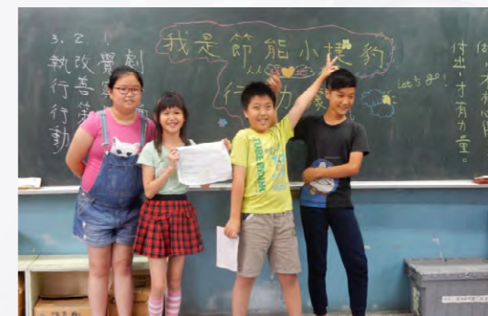
演出綠色生活行動劇