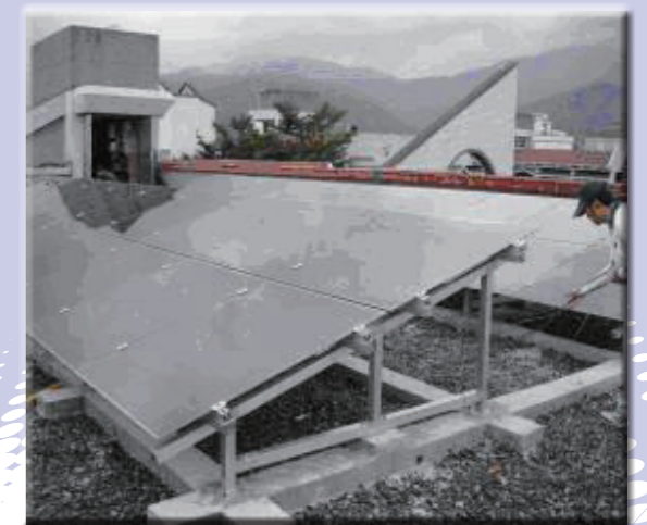
再生能源 - 太陽能發電系統