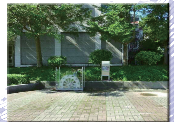
校門口水力發電教學區