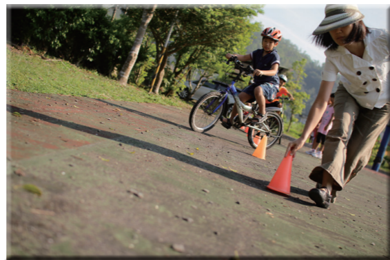
腳踏車考照，力行節能減碳。