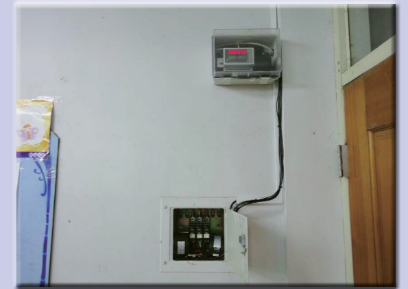
教室設置能源監控點