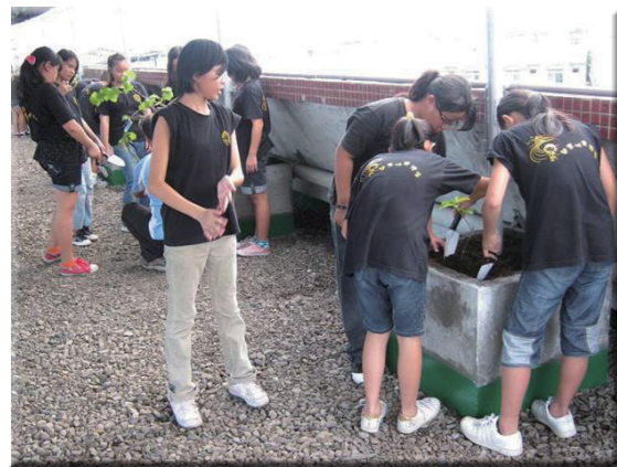
學生在屋頂種植爬藤植物，有效降溫節能