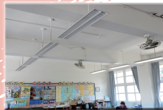
全面汰換為 T5 節能燈管