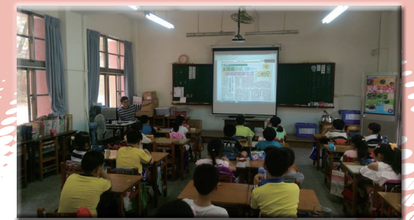
實施能源教育課程