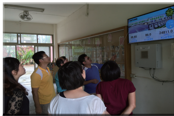
教師習取太陽能發電相關知識