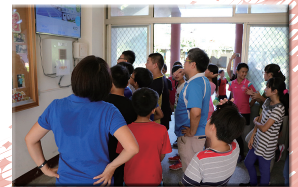
學生參與能源教育