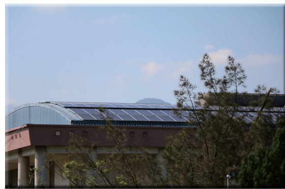
建置太陽能發電系統