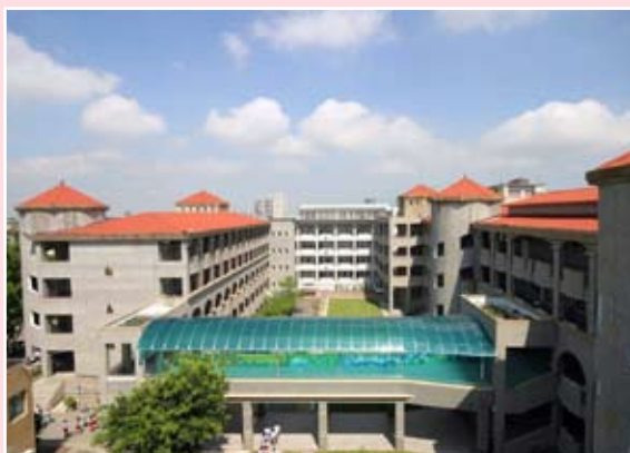
斜屋頂設計兼具隔熱及雨水回收