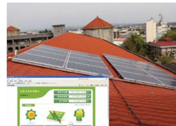
太陽能光電系統：透過網路回傳數據，用於實際教學