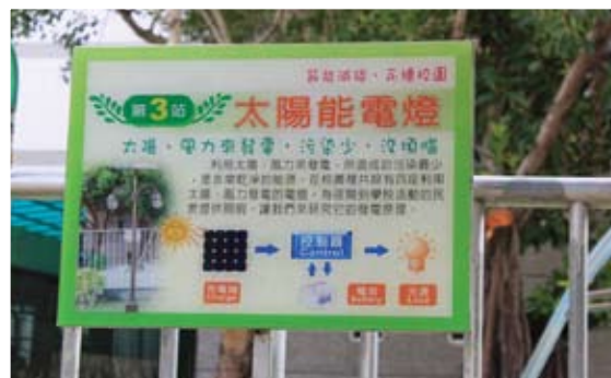
太陽能發電示範系統