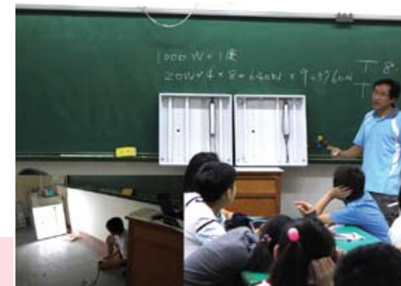
T8與T5燈具耗能與功率之比較