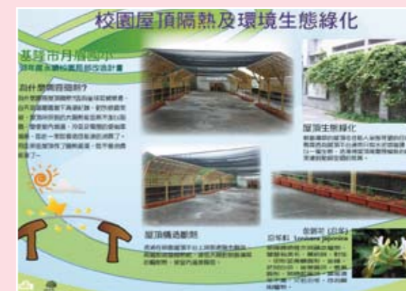
校園屋頂隔熱及環境生態綠化