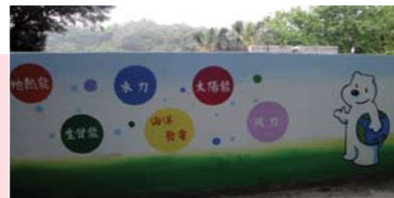
情境教學-再生能源學習走廊