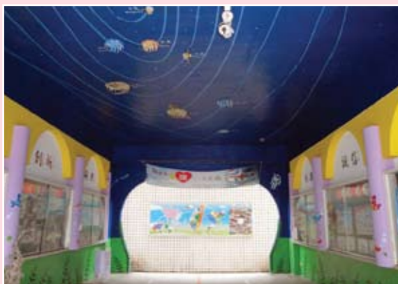
為地球降溫- LED環保節能宇宙光廊