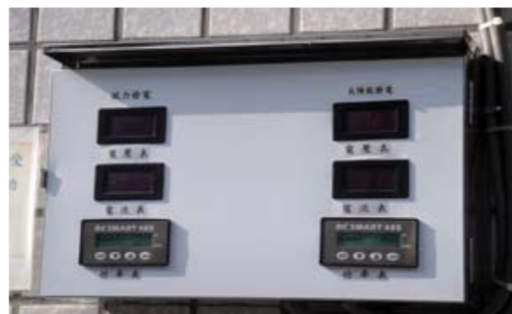
風光互補發電系統