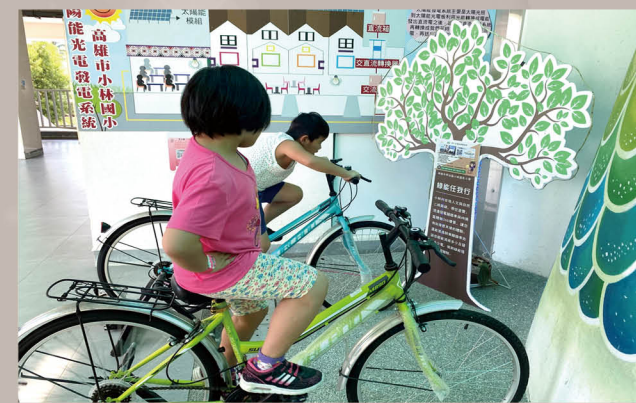
綠能任我行發電腳踏車