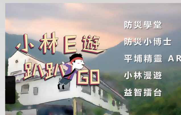
小林 E 遊趴趴 GO APP