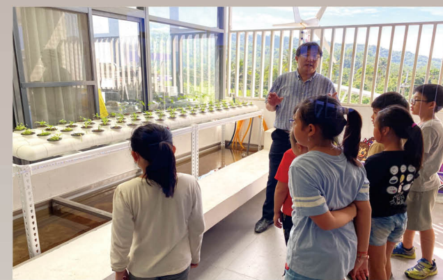
風力能太陽能永續教學循環系統