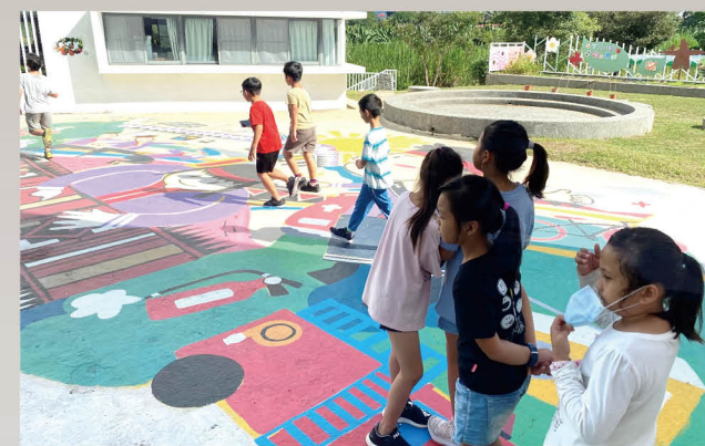
能源教育 AR 大富翁