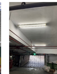
燈具全面更換為 LED 燈具